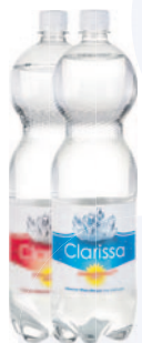
Pilatus Clarissa mit Co 2 ohne Co 2 6 x 150cl